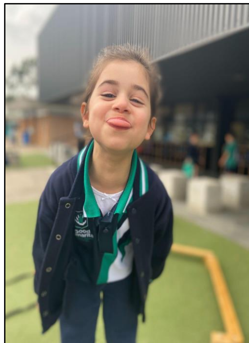
A highlight for me this term has been the way in which our wonderfully energetic Foundation children have commenced their first year of school. They have embraced their learning with joy, curiosity and a sense of fun!